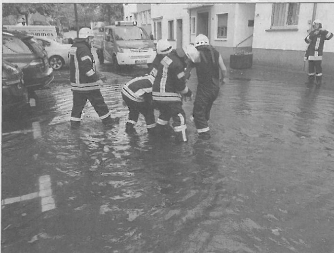
Einsatz der Feuerwehr im Staden in Saarburg nach Starkregen am 4. Juni 2016.